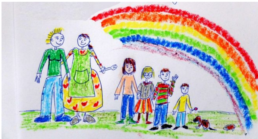
Mapa rodziny. Z archiwum projektu Rodziny z wyboru w Polsce

Miejszem taktyki jest miejsce innego, dlatego musi ono wykorzystywać obszar jej narzucony i zorganizowany przez obce prawo siły. [...] Nie ma więc możliwości stworzenia dla siebie całościowego planu działania ani ujarzmania przeciwnika w innej, widocznej i obiektywnie istniejącej przestrzeni. Dostosowuje się do sytuacji. Korzysta ze „sposobności” i od nich zależy, nie posiadając bazy, w której mogłaby zdobyć przewagę, powiększać własność i planować ataki. Nie zachowuje tego, co zdobywa. Ten brak miejsca gwarantuje jej pewną mobilność, która, choć zależna od upływu czasu, ułatwia pochwycenie w locie możliwości, jakie oferuje chwila. Zmuszona jest wykorzystywać, z całą ostrożnością, braki, jakie poszczególne koniunktury ujawniają w nadzorze władzy właścicielskiej. Kłusuje w nich. Zastawia pułapki. Może się znaleźć tam, gdzie nikt się jej nie spodziewa. Jest podstępem.