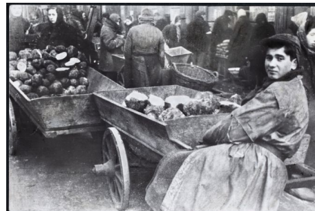
Obiekt 148. Obiekt 147.

AK: Czy to mogła być wielka akcja likwidacyjna? A może powstanie w getcie? Co tam się działo? Kto jest autorem tej serii? Czy chodzi tu o gwałty, o których wspominał Marek Edelman? W kontekście tych obrazów niejako automatycznie przypomniały mi się zdjęcia zrobione w czasie pogromu we Lwowie w 1941 roku. Do