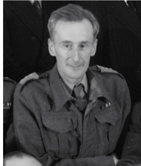
Józef Czapski w 1943 roku.

W kontekście pola sztuki wykorzystam ujęcie historyka tej dziedziny Piotra Piotrowskiego. Pisze on, że typowa historia nowoczesności tworzona w zachodnich centrach jest wertykalna i hierarchiczna. „Nie odsłania historycznych znaczeń przestrzeni i miejsca, w którym tworzona jest dana sztuka, [...] nie dekonstruuje relacji między centrum a marginesami światowej historii sztuki nowoczesnej” 8 . W tradycyjnym ujęciu z wielkich stolic Zachodu „wzory rozchodzą się po świecie, trafiając na peryferie. Sztuka w centrum wyznacza więc swoistego rodzaju paradygmat; sztuka na peryferiach to adaptacja wzoru wypracowanego w metropolii artystycznej” 9 . A zatem „kanony artystyczne, hierarchie wartości [...] w najlepszym przypadku są recypowane”, przyswajane i kopiowane na peryferiach. Dla Piotrowskiego i wielu innych badaczy jest oczywiste, że takie podejście jest fałszywe, ponieważ „sztuka nowoczesna