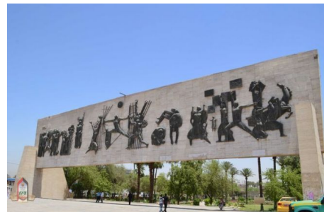
Dżawad Salim, Pomnik Wolności, plac Tahrir w Bagdadzie, Irak.

W 1958 roku w Iraku doszło do kolejnego przewrotu wojskowego, tym razem udanego, i w jego wyniku kraj uzyskał pełną, prawdziwą niepodległość. Salim, wówczas już jako artysta doceniony na świecie, zmarł w 1961 roku, kiedy pracował nad