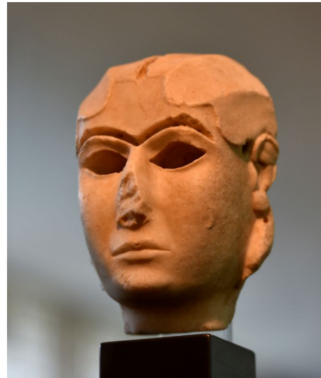
Maska z Warka (starożytne Uruk), Irak, 3000-2900 p.n.e., Muzeum Iraku, Bagdad.

Na wystawie w lutym 1943 roku Czapski wygłosił odczyt Źródła sztuki nowoczesnej , który następnie wydrukowany został w „Kurierze Polskim w Bagdadzie”; po latach artysta włączył go do paru zbiorów esejów. Tekst rozpoczyna się opisem zwiedzania muzeum bagdadzkiego z eksponatami z epoki sumeryjskiej, które zafascynowały malarza. Oprowadzał go dyrektor placówki, brytyjski archeolog Seton Lloyd, od 1939 roku doradca Departamentu Starożytności w Iraku szkolący miejscowych specjalistów. Anglik tłumaczył Czapskiemu, że pierwszy eksponat, powstały około 3300 lat p.n.e., to rzeźbiona w marmurze twarz kobiety, która „zamiast oczu ma głębokie żłobienia”, dawniej wypełnione drogocennymi kamieniami. Twarz „uderza swoją ekspresyjnością oraz nadzwyczaj realistycznym traktowaniem tematu” 55 , pisze artysta o eksponacie znanym jako „Maska z Warka” bądź „Kobieta z Uruk”. Wobec eksponatów Czapski nie używa wartościujących przymiotników z kolonialnego słownika. Gdy zestawiając różne obiekty, zapisuje, że w historii od zawsze występowały dwa elementy „pozornie sprzeczne – element abstrakcyjny i naturalistyczny. [...] Kiedy rzucimy okiem wstecz, na sztukę ludów, widzimy wszędzie te same dwa pierwiastki” 56 .