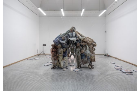
Lars von Trier & Bjarke Ingels, dekoracja do filmu Larsa von Triera Dom, który zbudował Jack (2018). Wystawa Big Art, 21 września 2018 – 13 stycznia 2019, Kunsthall Charlottenborg, Kopenhaga. / Kadr z filmu Melancholia. Lars von Trier, Dania, Francja, Szwecja, Niemcy 2011.

Może więc gównu wcale nie jest większym problemem teologicznym niż zło. Może to właśnie w „gównie” (niewykluczone, że i tym zapisanym bez cudzysłowu) jest większa eschatologiczna nadzieja niż w dobru.