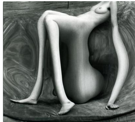
André Kertész, Distortion #141 , ok. 1933. Bruce Silverstein Gallery, New York.

Testuję więc stabilność terapeutki, jej zdolność do mieszczania mojej destrukcyjnej siły, znoszenia mojego smrodu, widoku mojego rozkładu. Sprawdzam, czy odwraca się ze wstrętem, czy karze mnie za popuszczanie, czy w ogóle potrafi się obejść z moim brudem. Czy nie zrobię jej krzywdy, sama odchodząc potem z niczym? Czy nie poczuje przypadkiem odoru jej odchodów? Czy nie będziemy się w tym tupać zbyt długo, bez widoków na czystą, stabilną wersję „ja”?