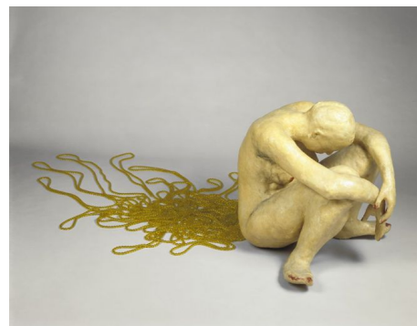
Kiki Smith, Pee Body , 1992. Harvard Art Museums/Fogg Museum.

Te trzy sposoby przejawiania się odchodów w relacji terapeutycznej – zakaz reprezentacji, jej nadmiar i reprezentacja pozorna – będą zarazem trzema rodzajami kierowanych do terapeuty nieświadomych komunikatów, trzema typami próśb o alternatywny model kontaktu z „nieczystym”. Są to też trzy sposoby nieodróżniania tego, co w nas żywotne, od tego, co w nas zużyte i co można bez żalu porzucić. Łacińskie słowo excreta , oznaczające „odchody”, wywodzi się z czasownika excerno – „odłączam, oddzielam”, utworzonego z kolei od cerno – „odsiewam, postrzegam, rozeznaję” 15 . Odchody będą więc tą częścią nas, którą – dzięki odpowiedniemu „rozeznaniu” – możemy od siebie odsunąć jako niepotrzebną, niesłużącą życiu, nadmiernie nas obciążającą. Skoro tak, to kiedy pacjentka domaga się od terapeutki, by ta pomogła jej obchodzić się z własnymi „fekaliami” inaczej niż do tej pory, odpowiedzią musi