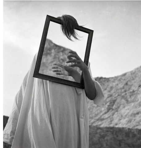
Herbert List, The Spirit of Lycabettus XXI , ok. 1937. Estate of Herbert List, Hamburg.

Teza głosząca, że stabilność tożsamości zależy od siły, z jaką będziemy doświadczać wstrętu, domaga się zatem uzupełnienia. Stałość obiektu oznacza przecież ostatecznie zastygnięcie podmiotu: staje się on tak stabilny, że właściwie pozbawiony życia, niezdolny do metabolizowania nowych informacji