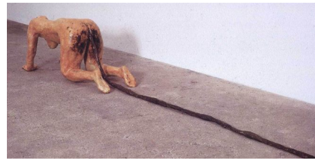
Kiki Smith, Tale , 1992. Kolekcja Jeffreya Deitcha.

Będzie to – mimo pozornej jawności, sugerowanej przez kategorię „inscenizacji” – jak najdalsze od koprofania. Greckie phaino oznacza „wydobyć na jaw”, ale też „pokazać coś jako swoje” i „wskazywać” (na przykład drogę) 18 . Wybierając rozgrywanie, pozostaję strażniczką wyparcia i nie mogę stać się odpowiedzialna za własne działania. Nie mam z „ekskrementami” żywego kontaktu, ale też nie mam wyboru. Moja „nieczystość” działa we mnie i przeze mnie, przysparza mi cierpienia, choć zarazem chroni mnie przed wspomnieniem dawnego bólu. Nie wiem też, co dalej – nie wiem, co robić, ponieważ nie mam pojęcia, czego potrzebuję. Wprowadzenie „fekaliów” w obszar widzialności dałoby mi nadzieję na wybór (nie byłabym już skazana na inscenizowanie), pozwoliłoby mi wziąć odpowiedzialność oraz wskazałoby drogę: przepływ otworzyłby mnie na samą siebie, dowiedziałabym się od moich własnych „wydalin”, czego mi trzeba.