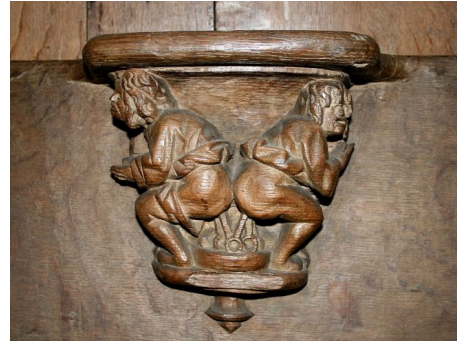
Wypróżniający się , 1531. Mizerykordia na drewnianej stalli, bazylika Saint-Materne, Walcourt, Belgia.

W jednym z fragmentów Twórczości Franciszka Rabelais'go Bachtin przytacza fragment w prześmiewczy sposób opowiadający o duszy umierającego poety Mruczysława, wędrującej po śmierci nie do nieba, nie do piekła nawet, lecz pod zad Prozerpiny, do miejsca, gdzie załatwia ona swoje potrzeby 26 .