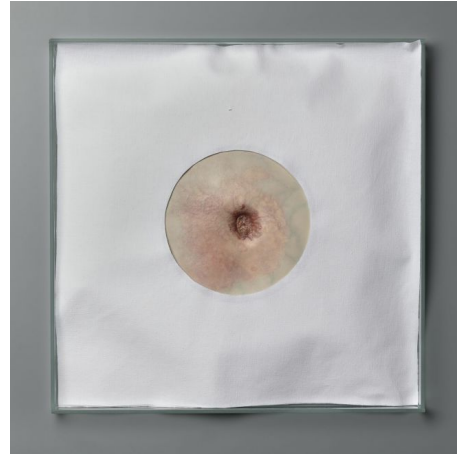
Magdalena Moskwa, Bez tytułu, nr 72, 2013. Muzeum Narodowe w Warszawie.

Psychoterapeutka powie, że nie wystarczy pozbyć się własnego symptomu – trzeba go jeszcze pokochać (czasem zresztą to drugie jest warunkiem pierwszego). Dlatego nasza czujność powinna się wzmacniać, gdy słyszymy zachęty do stawania się „najlepszymi wersjami siebie”. Nie są one niczym innym niż zawołowanymi formułami egzorcystycznymi, a historia aż nadto dobitnie pokazała nam, jak niebezpieczne mogą być wspólnoty budowane