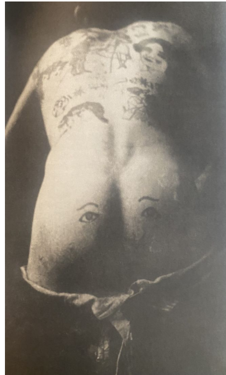
Wytatuowany mężczyzna, fotograf nieznany, ok. 1900. Dokument z kolekcji Roberta Girauda, Paryż.

Jednocześnie to, co wyparte 16 , zakazane i zawstydzone, jako obdarzone energią, będzie nam nieustannie zagrażać: grawitować ku swojemu źródłu („Wstręt – pisze Kristeva – [...] ujawnia, że podmiot jest w ciągłym niebezpieczeństwie” 17 ). Jeśli wejdziemy w proces terapeutyczny, „ekskrementy” wcześniej czy później zaczną dopominać się o uwagę, domagać się zauważenia, na różne sposoby się inscenizować, a niekiedy nawet przejmować kontrolę nad procesem analizy. Zechcą zaistnieć jako autonomiczna siła. Będą aktywnie szukały strategii bezpiecznego zaistnienia. Zresztą skoro fekalia są obrazem tego, co powstaje wewnątrz pacjentki, to dla jej dobra nie powinny tam pozostać. Jeśli analiza ma się toczyć, terapeutka, a za nią pacjentka, muszą istnienie