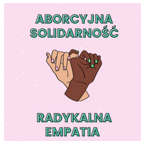
Grafiki pomocowej organizacji pro-choice Aborcyjny Dream Team

Punktem wyjścia dla rozważań kończących niniejszy artykuł chciałabym uczynić ponownie cytowany już tekst Judith Butler, tym razem na plan pierwszy wysuwając proponowane w nim ujęcie kruchości. Żaden dyskurs, twierdzi Butler, nie radzi sobie do końca z kruchością. Kruche jest takie życie, które może zostać utracone lub zranione, którego istnienie wytwarza potencjał żałoby. Kruchość jest kondycją łączącą ludzkie i nie-ludzkie zwierzęta, lecz nie każde kruche życie postrzegamy jako warte ochrony: także dlatego, że nie da się podtrzymywać całego życia, a istotną część życia stanowią procesy degradacji. Życie musimy ocenić jako nadające się do przeżycia. „Życie nie istnieje bez warunków do życia” – pisze Butler, wskazując na kluczowe pytanie, które musimy sobie zadać: „czy społeczne warunki przetrwania i utrzymania się w formie są czy nie są do spełnienia?” 62 . Postawienie tego pytania wiąże się zawsze z najtrudniejszymi dylematami etycznymi. Choć nie rozwiąże to wszystkich problemów, można starać się stworzyć społeczne