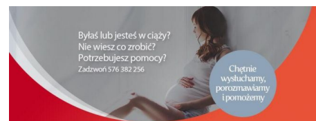
Grafiki ewangelikalnych organizacji pomocowych: Misji Nie Jesteś Sama oraz Kobietom na Pomoc

„Kiedy ramy, by się zainstalować, zrywają same ze sobą, wyłaniają się inne możliwości uchwycenia tego, co miały nam pokazywać” 60 – pisze Judith Butler. Nie można przekonująco pokazać ontologii zależności za pomocą narzędzi wizualnej hegemonii (pokazuje to nieudana próba Fundacji „Nasze Dzieci”: „Jestem zależny, ufam tobie”), można jednak opowiadać o niej za pomocą zestawu praktyk, który, próbując instalować ramę pro-life, łamie ją. By podążać za kobietą i jej potrzebami (w nadziei, że urodzi dziecko), potrzebne są bowiem kompromisy: uszanowanie jej wyborów,