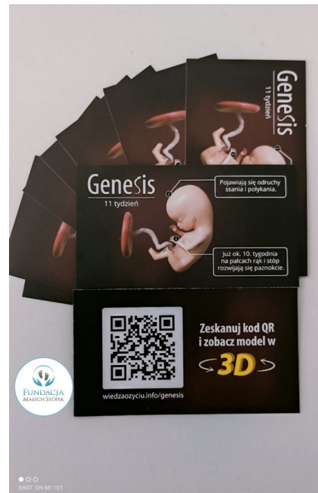
Grafiki Fundacji Małych Stópek: ulotki i karty umożliwiające oglądanie rozwoju płodu w trzech wymiarach