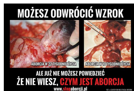
Grafiki Fundacji Pro – Prawo do życia, źródło: https://stronazycia.pl/fundacja/wystawy/ ; https://www.facebook.com/FundacjaPro/

Fundacja czerpie z doświadczeń i zasobów ikonicznych amerykańskiej organizacji Priests for Life, rezygnując z przekazu pozytywnego – zdjęć rozwoju prenatalnego – i skupiając się na przekazie negatywnym, czyli prezentacji „prawdy o aborcji”. Cel przyświecający wystawom dobrze opisuje jeden z plakatów. Napis na planszy ze zdjęciami dwóch martwych płodów różnej wielkości