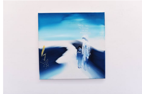
Ola Winnicka, olej na płótnie, bez tytułu, seria Motherism

Obydwa te znaczenia kategorii fantazmatu – Ledera i Platy – podkreślają normatywizujący, a więc jednocześnie trwałe i niezmienny charakter fantazmatycznych struktur wyobraźniowych. Jeśli spojrzymy na kategorię fantazmatu