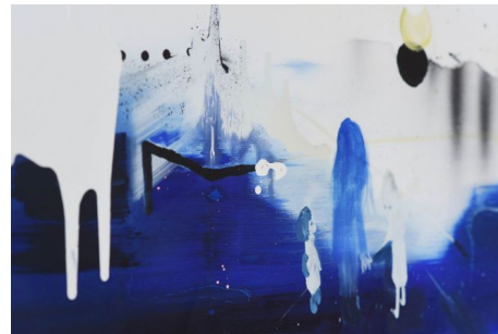
Ola Winnicka, olej na płótnie, bez tytułu, seria Motherism

Podobny głos córek można rozpoznać w polskiej historii feminizmu. Na przykład figura matki jako zestaw znaczeń dekonstruowany przez młode pokolenie redakterek i autorek