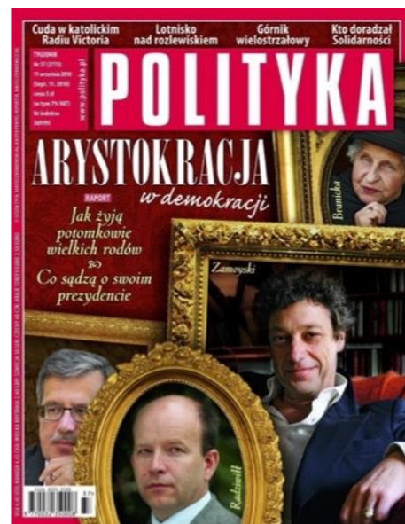
Okładka 37/2010, „Polityka” 2010, nr 37.

Wobec tych sprzężeń i niejednoznaczności warto zapytać o to, czy i jak reprezentacje arystokracji uczestniczą w procesach kształtowania się i podtrzymywania dominacji klasowych w Polsce. Wydaje się bowiem, że pozornie zawarte w nich odwołanie służy równocześnie odwróceniu uwagi od realnych kapitałów 4 i statusów przedstawianej grupy jako istotnej części współczesnej elity. Skupienie na przyrodzonych cechach przedstawicieli arystokracji i odtwarzanie historycznie zakorzenionych tradycji (również tradycji reprezentacji elit) interpretować można jako część