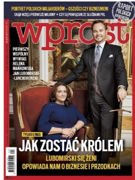
Okładka 44/2018, „Wprost” 2018, nr 44.