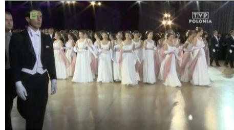
Debiutanci i Debiutantki, kadr z video Bal debiutantów z różą w tle , TVP Polonia, https://www.tvp.pl/polonia/reportaz-i-dokument-w-tvp-polonia/bal-debiutantow-z-roza-w-tle/22376294 , dostęp 10 grudnia 2020.

Arystokraci dosłownie „jak z obrazka” są również bohaterami reportażu TVP Polonia relacjonującego jedno z najważniejszych wydarzeń powiązanych ze środowiskiem arystokratycznym, czyli Balu Debiutantów 36 . Płynne przejścia montażowe nakładające na siebie postacie z obrazów ze zbiorów