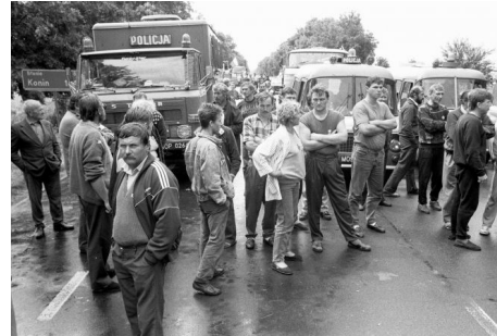
Blokada drogi w Ołtarzewie k/Błonia, 6 lipca 1992, fot. Kuba Atys / Agencja Wyborcza.pl

Za najbardziej spektakularną taktykę protestów chłopskich okresu transformacji można uznać skoordynowane blokady dróg – jak te, które sparaliżowały kraj 11 lipca 1990 roku czy zatrzymały ruch na przejściu granicznym w Świecku w nocy z 21 na 22 stycznia 1999 roku. Blokady uderzają w jedną z podstawowych wartości kapitalistycznych: możliwość swobodnego przemieszczania towarów. W 1999 roku Andrzej Lepper regularnie „wzywał rolników do zablokowania przejść granicznych, aby uniemożliwić przywóz do Polski taniej zachodniej żywności i produktów rolnych” 43 . W blokadach godzinami stały TIR-y rozjeżdżające w latach 90. polskie drogi. Transformacyjna Polska oczywiście porusza się nie tylko w związku z obiegiem towarów – w latach 90. pracownicy coraz częściej dojeżdżają do pracy samochodami, jeździ się nimi na urlopy, weekendy i rodzinne święta, wzrasta również liczba posiadaczy aut. Rolnicze blokady od początku wzbudzają silne emocje społeczne, choć wydaje się, że dziennikarskie doniesienia oraz nagrania koncentrujące się na atrakcyjnych dramaturgicznie konfrontacjach pomiędzy przedstawicielami innych klas społecznych a uczestnikami blokad nieco wypaczają rzeczywisty społeczny odbiór protestów. Badania opinii publicznej przeprowadzone w 1991 i 1999 roku bezsprzecznie pokazują wysokie społeczne poparcie dla protestów rolników, w tym w roku 1999 również poparcie większości respondentów dla blokad dróg i przejść granicznych 44 . Wyjątkowo ofensywnie