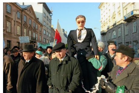
Demonstracja rolników w Warszawie, 3 grudnia 1998, fot. Sławomir Kamiński / Agencja Wyborcza.pl

Masowo wytwarzane przez protestujących i często poddawane przemocy kukły różnią się pod względem wykonania – od tych najbardziej realistycznych, ze starannie pomalowanymi głowami z papier mâché , w kompletnym garniturze, krawacie i butach, do obszytych materiałem worków z twarzą namalowaną czarną kreską lub kukieł ze styropianu. Niekiedy przedstawiają konkretne osoby – najczęściej oczywiście Leszka Balcerowicza – innym razem reprezentują uogólnioną