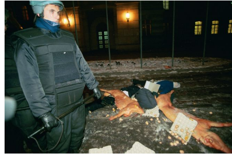
Demonstracja rolników w Warszawie, 3 grudnia 1998, fot. Sławomir Kamiński / Agencja Wyborcza.pl

Paradoksalnie zarówno marnotrawienie żywności, jak i dzielenie się nią ma uwidocznić podstawową bolączkę polskiej wsi: nieopłacalność niemal całej produkcji rolnej na początku lat 90. oraz konkretnych produktów pod koniec tej dekady. Jak powszechnie narzekają rolnicy, nakłady wydatkowane na produkcję przewyższają wartość wytwarzanego jedzenia. Czasem produkty marnuje się już na polach: „Wielu rolników podchodzi do tego z ołówkiem w rękę i po prostu niszczy zboże, tzn. orze, talerzuje, pali. Rachunek ekonomiczny jest akurat taki, a nie inny, i z tego rachunku wynikało, że lepiej jest zaorać 8 hektarów owsa niż go zbierać” 63 . Wyrzucanie ziemniaków przed budynkami rządowymi i rozdawanie ich przechodniom w gruncie rzeczy dowodzi, że zgodnie z rachunkiem ekonomicznym w określonych warunkach są one niewiele warte. Praktyki publicznego marnotrawienia i rozdawania żywności podają więc w wątpliwość procesy nadawania wartości w kapitalizmie.