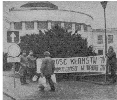
Protest NSZZ "Solidarność" RI, 11 stycznia 1990

Okupujący gmachy i tereny rządowe chłopcy chcą poprzez zajęcie przestrzeni im nieprzynależnych zmusić rządzących do działania, z petentów apelujących do państwa zmieniają się w inicjatorów dialogu prowadzonego w przeznaczonych do tego przestrzeni. Postulaty, skargi i żale zaczynają wybrzmiewać w miejscach, w których zwykle podejmowane są decyzje. „Będziemy siedzieli aż do skutku”, deklarują za każdym razem, choć zazwyczaj okupacje przerywane są przez policję bez przyjęcia ich postulatów. W akcjach okupacyjnych łączy się dwojakie rozumienie reprezentacji – politycznej i medialnej. Okupując przestrzeń rządową, chłopcy zyskują widzialność –