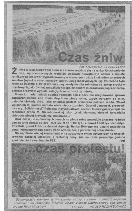
„Chłopska Droga” z 22 lipca 1990

Rolnicy walczyli więc o realizację własnych interesów klasowych, w które godzą neoliberalne mechanizmy gospodarcze, przede