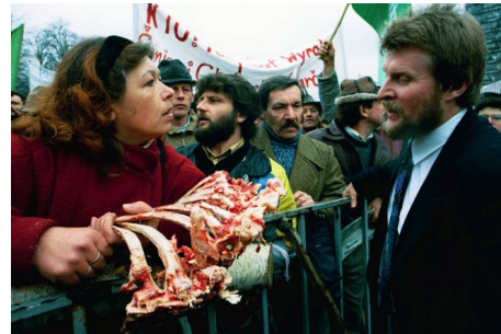
Demonstracja pod Sejmem, 2 kwietnia 1993, fot. Sławomir Kamiński / Agencja Wyborcza.pl

Skrajnym przykładem wprowadzania nieczystości do przestrzeni miejskiej jest inny popularny obiekt-groźba, czyli plastikowa torba z gnojówką, opróżniana niekiedy przed gmachami rządowymi. Bronią w sensie dosłownym gnojówka stała się podczas starcia rolników z policją w Lubecku zimą 1999 roku, kiedy wylewane szlauchami odchody były odpowiedzią na policyjne armatki wodne.