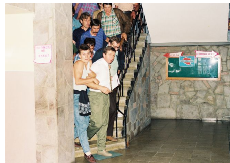
Protest w Praszce, sierpień 1993, fot. Tadeusz Olejnik, dzięki uprzejmości autora

W sierpniu 1993 roku działacze Samoobrony wsparli protesty mieszkańców Praszki, miasteczka położonego w województwie opolskim, którzy masowo zasilili szeregi bezrobotnych po serii zwolnień grupowych w zakładzie motoryzacyjnym Polmo 31 . Podczas protestów wywieziono z urzędu na taczce burmistrza Praszki z ramienia Unii Demokratycznej (byłego pracownika restrukturyzowanego zakładu, a zatem dawnego kolegę z pracy), co wywołało oburzenie wielu polityków i dziennikarzy. Akcje protestacyjne w Praszce trwały dwadzieścia kilka dni. W tym czasie zmuszono burmistrza do dymisji, obwieszono miasto transparentami i flagami, a także regularnie okupowano i blokowano miejskie urzędy, domagając się między