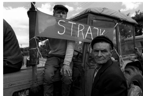
Blokada drogi w Mławie, 15 czerwca 1990, fot. Sławomir Sierzputowski / Agencja Wyborcza.pl

12 czerwca 1990 roku indywidualni dostawcy mleka rozpoczynają blokadę dróg otaczających Mławę, w tym „siódemki” łączącej Warszawę z Gdańskiem. Ponad 500 osób żąda zapłaty za dostarczone w maju mleko oraz podwyższenia cen skupu. O wsparcie w negocjacjach z Okręgową Spółdzielnią Mleczarską apelują do Tadeusza Mazowieckiego i Lecha Wałęsy, „których popierali i [na których] głosowali” 2 . Trzy dni później rząd odrzuca postulaty rolników i upoważnia Komendanta Głównego Policji do usunięcia blokady, dopuszczając użycie przemocy wobec protestujących. Do Mławy lecą „helikoptery z oddziałami specjalnymi” i jadą „transportery opancerzone” 3 . Jak twierdzą świadkowie, do zastosowania przemocy nie dochodzi jedynie dzięki staraniom dowódcy miejscowych oddziałów policyjnych 4 . Tuż przed upływem terminu rządowego ultimatum rolnicy zawieszają blokadę, a protest kończy się po mediacjach prowadzonych przez przewodniczącego „Solidarności” Lecha Wałęsę 5 . „Dzięki ustawionym na zewnątrz budynku głośnikom [przysłuchuje się im] ponad tysiąc napierających na bramę producentów mleka” 6 .