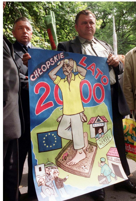
Pikieta rolników pod Kancelarią Prezesa Rady Ministrów, Warszawa, 27 lipca 2000

Na protestach, których rejestracje prezentujemy, doraźne żądania formułowane wobec sprawującego władzę rządzący zdecydowanie dominują nad wizją możliwej do wytworzenia wspólnoty i alternatywnego porządku gospodarczego. Z pewnością jednak w pierwszej dekadzie transformacji podstawowe zasady neoliberalnej ekonomii są w chłopskiej sferze przeciwpublicznej kwestionowane równie żarliwie, jak żarliwie bronią przez przedstawicieli liberalnej klasy