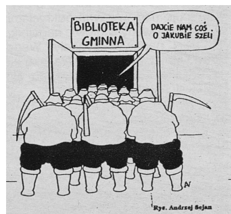
"Nowa wieś" 1992, nr 8, s. 4

Do trzech głównych elementów chłopskiego repertuaru kontestacji warto dodać zestaw praktyk, które za Nicholasem Mirzoeffem można określić jako przykłady aktywizmu wizualnego. Amerykański badacz opisuje go jako produkcję obrazów przez grupy zdominowane, wynikającą z przeświadczenia, że „oni nas nie reprezentują, [więc] sami musimy znaleźć sposoby tworzenia własnych