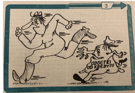
Ilustracja z czasopisma "Chłopska Droga"

– tożsamość chłopską komunikuje się tu przy użyciu prostych tropów wizualnych: luźne ubranie i czapka, duży, obły nos, gumki; wiejską przestrzeń sprowadza się natomiast do pola lub ganka chałupy. Bez wątpienia ostrze satyry wymierzone jest jednak w kulturę dominującą: wykańczające rolników kredyty (worek z napisem „odsetki od kredytu” ścigający przerażonego mężczyznę; walizka z pieniędzmi, która okazuje się „kredytem wziętym na kredyt”); reformy gospodarcze („plan Balcerowicza” alegoryzowany jako pętla na szyi), reprivatyzujących posiadłości ziemian (pomnik wystawiony dziedzicowi) czy też konkretnych polityków, do których zdjęć dodawane są komiksowe dymki. „Biedazupka to jest to”, mówi Jacek Kuroń, Lech Wałęsa prosi: „Tylko nie mlekiem po oczach”, a Leszek Balcerowicz zastanawia się, „jak pokochać wieś”. Humor, często czarny, nie rozmywa politycznego wymiaru ostrych analiz wiejskiej rzeczywistości obecnego w reportażach i felietonach. Jest raczej kolejnym sposobem opowiadania o codziennym doświadczaniu skutków transformacji ustrojowej, o wymiernych efektach globalnych