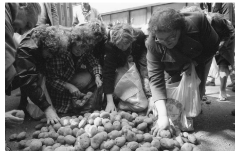
Mieszkańcy zbierają wyrzucone przez rolników ziemniaki, Warszawa, 26 kwietnia 1990

Wprowadzenie czasu przeszłego do hasła wykorzystywanego przez ruch ludowy od czasów insurekcji kościuszkowskiej (również przez rolniczą „Solidarność” w latach 80. XX wieku 59 ) funkcjonuje jako wyraźny sygnał odchodzenia od chłopskiego etosu „żywicieli narodu” wobec pogarszających się warunków prowadzenia gospodarstw rolnych. Tradycyjnie pojmowana chłopska powinność, czyli obowiązek dostarczania żywności do miasta, zostaje podana w wątpliwość. Konflikty na linii miasto–wieś związane z procesem dostarczania żywności na rynek nie pojawiają się rzecz jasna dopiero w okresie transformacji, to wówczas jednak chłopci podejmują działania mające na celu pokazanie miastu – i przede wszystkim rządzącym