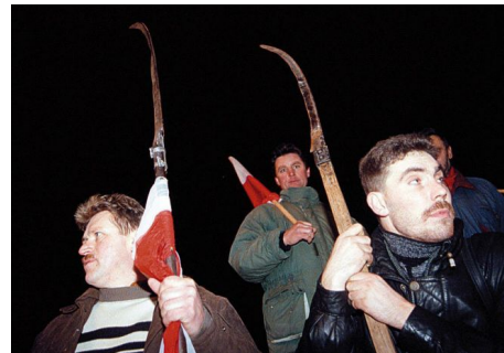
Blokada przejścia granicznego w Świecku, styczeń 1999, fot. Sławomir Sajkowski / Agencja Wyborcza.pl

Na rysunku opublikowanym w „Nowej Wsi” pod artykułem o pierwszym krajowym zjeździe Samoobrony jednorodnie i stereotypowo narysowana grupa chłopów – szerokie plecy, spodnie włożone w gumaki, czapki, kosy na sztorc – kłębi się przed otwartymi drzwiami, nad którymi wisi napis: „Biblioteka gminna”. „Dajcie nam coś o Jakubie Szeli”, czytamy w komiksowym dymku. Odwołując się do historycznej pamięci chłopskiej sprawczości i przemocy, rysunek funkcjonuje jako ilustracja opisywanych w tekście „rewolucyjnych nastrojów” nowo zorganizowanego ruchu społecznego. Jak się jednak wydaje, również z powodu