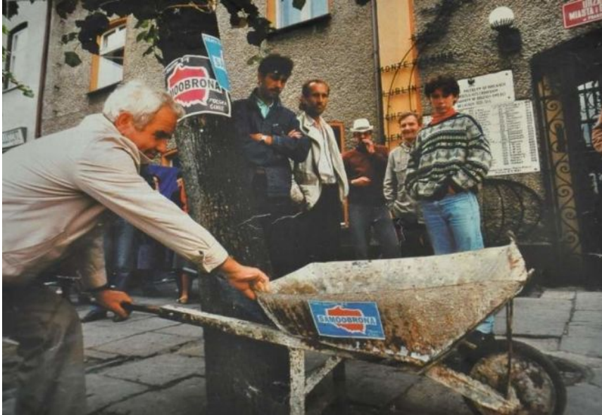
Zdjęcie z artykułu "Znowu taczki", "Miliarder" z 26 sierpnia 1993

Taczki – ta z Praszki „czeka[jąca], przypięta łańcuchem do drzewa naprzeciw Ratusza” 36 i te przygotowywane przez Leppera, na których ludzie wywieźć mogą „rząd i Belweder” 37 – przywodzą na myśl wprowadzony przez badacza ruchów społecznych Charles’a Tilly’ego termin „repertuar kontestacji”, czyli „pełen zestaw środków którymi dysponuje [dana grupa], służących stawianiu rozmaitych żądań różnym podmiotom i grupom” 38 . Na ów repertuar składają się podejmowane przez uczestników ruchów społecznych działania, takie jak listy protestacyjne, demonstracje, strajki i okupacje, ale także ataki na pomniki, porywanie przedstawicieli władzy czy wypędzanie poborców podatkowych. Zaproponowana przez badacza metafora sceniczna ma wydobyć napięcie pomiędzy powtarzalnością i zaskakującym podobieństwem (z perspektywy badaczki źródeł wizualnych można również powiedzieć: monotonią) wykorzystywanych technik protestu a potencjalną niepowtarzalnością każdego wykonania. Tilly pisze: