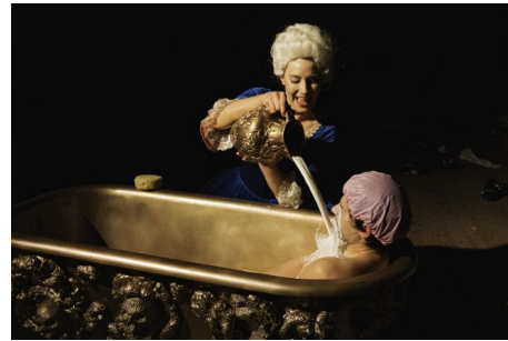
Czarna skóra, białe maski , reż. Wiktor Bagiński, scenariusz Wiktor Bagiński i Paweł Sablik, scenografia i kostiumy Anna Oramus, muzyka Bartek Prosuł, Karol Kossakowski, choreografia Krystyna Lama-Szydłowska, Teatr im. Kochanowskiego w Opolu, premiera 8 listopada 2019.

Szereg napięć, jakie wywołuje przedstawianie czarności, wiąże się z wpisaniem jej w projekt kultury polskiej jako spójnej wizji