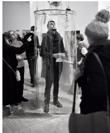
Widok wystawy, Kreatywne Stany Chorobowe: AIDS, HIV, RAK , Galeria Miejska Arsenal.

Oddolny, emancypacyjny ruch radykalnego przeformułowania paradygmatu kultury, którego częścią stały się tęczne sojusze osób LGBTQ+, jest nieoceniony dla zmiany oblicza