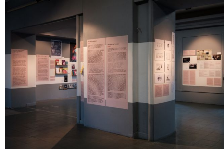
Widok wystawy, HIVstorie: Żywe polityki , Biennale Warszawa.

Reprezentując aktualny trend art based research , obie wystawyprowokują dyskusję na temat prowadzenia badań za pomocą sztuki, przełamywania dualizmu sztuki i nauki oraz specyfiki sztuki czy wystaw powstających w wyniku researchu. Prowokują również pytania o to, kiedy sztuka staje się argumentem wypracowanym w ramach danego tematu wystaw badawczych, a kiedy jest argumentem z kuratorskiego nadania 17 .