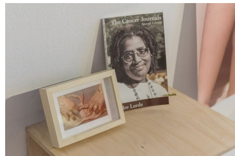
Widok wystawy, Kreatywne Stany Chorobowe: AIDS, HIV, RAK, Galeria Miejska Arsenał, Poznań.