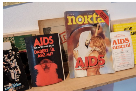
Widok wystawy, HIVstorie: Żywe polityki , Biennale Warszawa.

Zgodnie z aktywistycznymi strategiami DIY, do ich ekspozycji posłużyły skromne, zamontowane na ścianach półki. W efekcie kolektywnej pracy status i zasięg oddziaływania tych artefaktów został zmieniony. Wcześniej funkcjonowały w innym obiegu, tu natomiast wpisane zostały w badawcze praktyki archiwizacji i reprezentacji. Ich widoczność została dodatkowo wzmocniona poszerzonym kontekstem ich użyteczności w sferze publicznej. Choć w Arsenale podjęto wyraźniejsze zabiegi dotyczące aranżacji materiałów i ich artystycznego opracowania, w przypadku obu wystaw raczej trudno mówić o przełomach w definiowaniu i upowszechnianiu specyficznej sztuki opartej na badaniach. W związku z tym przy zwiedzaniu obu ekspozycji można było mieć wrażenie pewnego nadmiaru – w Poznaniu wynikającego z włączenia do pokazu kilku