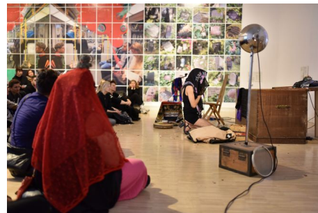
Widok wystawy, Kreatywne Stany Chorobowe: AIDS, HIV, RAK , Galeria Miejska Arsenal.

Nie jestem w stanie przewidzieć, czy tekst pisany w ekstatycznej aurze zorzy polarnej, w trakcie wielkiej ciemnej nocy, spełni swoją funkcję, stwarzając możliwość uzdrawiającej kulturowej identyfikacji osobom o zbliżonych doświadczeniach. Nie idealizuję Norwegii, której mieszkańcy borykają się z własnymi problemami, takimi jak formatowanie czy wysoki stopień kontroli społeczeństwa przez państwowe instytucje. Czas mojego pobytu