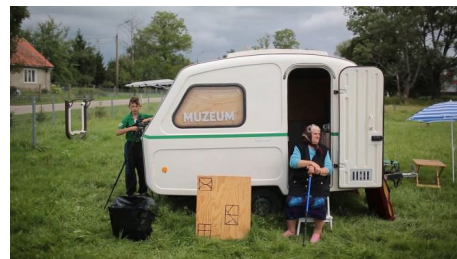
Muzeum migracji, autorka akcji: Agnieszka Pajczkowska; współpraca: Dorota Borodaj, Jan Mencwel, Jan Wiśniewski; produkcja: Towarzystwo Krajoznawcze Krajobraz, Krytyka Polityczna, Europejska Fundacja Kultury. Klatka z filmu autorstwa Kamili Szuby.

I.S.: To wynika częściowo z moich doświadczeń. Dwa źródła mojej aktywności artystycznej, czyli kultura czynna, mocno zaangażowane politycznie sztuka i teatr, spotkały się ostatecznie w sztuce ze społecznością. Z tego połączenia wyrasta dla mnie ten projekt badawczy, który z jednej strony wymaga umiejętności performatywnego opracowywania praktyk wspólnotowych, a z drugiej strony jest świadomy socjologicznie i ma ambicje dokonywania bezpośredniej interwencji politycznej.