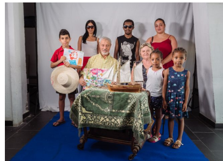
Neighbours , autor akcji: Paweł Ogrodzki; współpraca: Aziz Boumediene; produkcja: Krytyka Polityczna, Les Têtes de l'Art.

Wasz raport Kultura i solidarność 2 oraz działania, które w nim opisujecie, wpisują się w postrzegalne w przestrzeni publicznej zainteresowanie pojęciami i kategoriami zwracającymi się ku afektom, emocjom, zorientowanymi wokół relacji międzyludzkich,