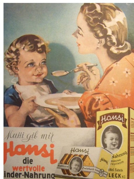
Il. 5. Reklama sucharów i kaszki Hansi.

swoje produkty za pomocą dokładnie tych samych obrazów, które kilka lat wcześniej drukowali w prasie nazistowskiej. Również przywołana już tu reklama odżywki Hipp pochodziła z lat 30. (il. 5). Inne powojenne reklamy prawdopodobnie opracowywane były przez przedwojennych projektantów. Wraz z bezwarunkową kapitulacją nie pojawili się przecież ani nowi rysownicy, ani tekściarze. Kontynuacje personalne tłumaczyłyby liczne podobieństwa stylistyczne między reklamami drukowanymi przed wojną, w jej trakcie i po jej zakończeniu. Trudno tu jednak uniknąć trybu przypuszczającego, gdyż niewiele wiemy o produkcji