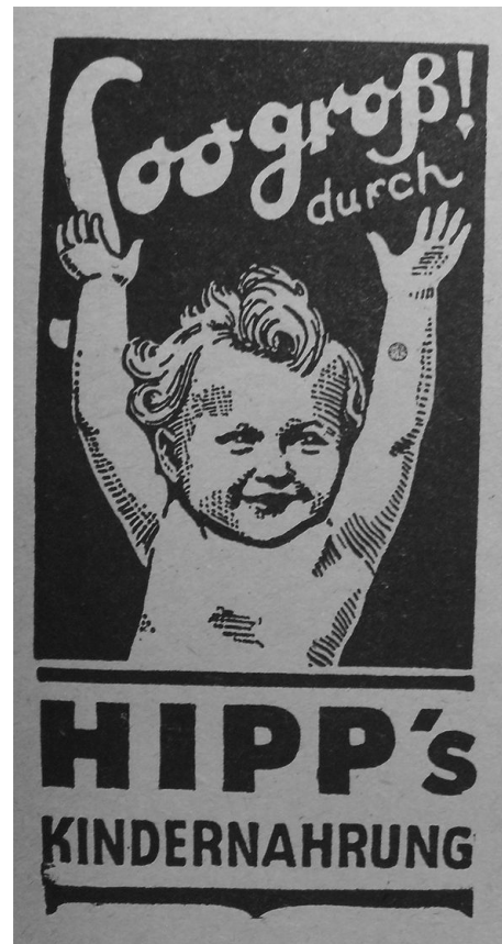
Il. 5. Reklama odżywek dla dzieci Hipp. Podpis: „Taaaaki duży dzięki odżywkom Hipp”.

Reklamodawcy nie podpowiadali jednak innego użycia produktu niż to zgodne z przeznaczeniem, zapewne ze względu na możliwe oskarżenia o nadużycia systemu kartkowego oraz związany z tym przekaz o ciągłych niedoborach. Zamiast sugerować, że w kraju brakuje nawet mleka, reklamy oferowały pozytywne obrazy szczęśliwych matek i najedzonych niemowląt (il. 6); podkreślały wartości odżywcze poszczególnych produktów, a także informowały o ich bogactwie kalorycznym.