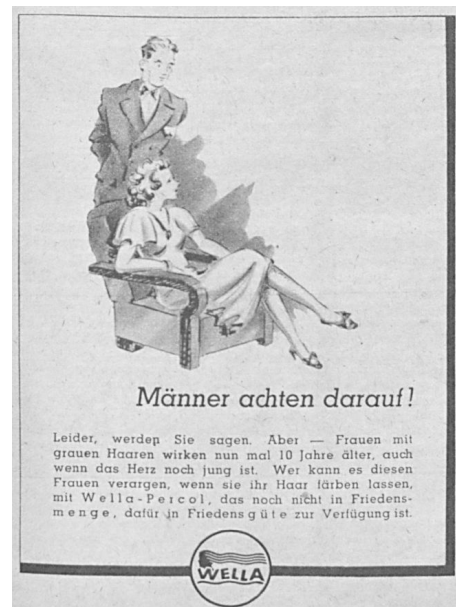
Il. 4. Reklama farby do włosów Wella.

Reklamy dostępnej do dziś farby do włosów marki Wella (il. 4) pojawiły się na początku 1948 roku równoległe w „Die Frau von Heute” oraz w tygodniku „Sie” (Ona), który ukazywał się w amerykańskiej strefie okupacyjnej. Przykład ten pokazuje skądinąd, że analiza powojennych reklam niemieckich w podziale na strefy okupacyjne ma ograniczony sens. Po pierwsze te same reklamy drukowane były w prasie wschodnio- i zachodnioniemieckiej, po drugie aż do reformy walutowej