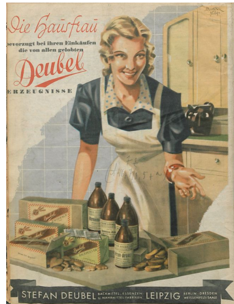
Il. 1. Reklama produktów spożywczych firmy Deubel. „Podczas zakupów pani domu preferuje sprawdzone produkty Deubel”.

Na ostatniej stronie wschodnioniemieckiego dwutygodnika „Die Frau von Heute” (Dzisiejsza kobieta) z marca 1946 roku widniała całostronicowa reklama firmy spożywczej Deubel z Lipska (il. 1). Kolorowa ilustracja przedstawia kobietę nachyloną nad kuchennym stołem zastawionym artykułami spożywczymi. Hasło reklamowe głosi: „Podczas zakupów pani domu preferuje wyroby firmy Deubel”. Złożony rzeczownik „pani domu” napisany jest elegancką czerwoną czcionką, podobnie jak nazwa marki. Szczupła blondynka ubrana w niebieską sukienkę i śnieżnobiały fartuch prezentuje herbatniki, suchary, aromaty do ciast i proszki do pieczenia. Ręka, która wskazuje jednocześnie na produkty i na patrzącego poza obrazem, ozdobiona jest błyszczącą czerwoną bransoletką. Za plecami kobiety stoi biały kredens kuchenny, a na nim ciemny dzbanek. Pomieszczenie wyłożone jest błękitnymi kafkami.