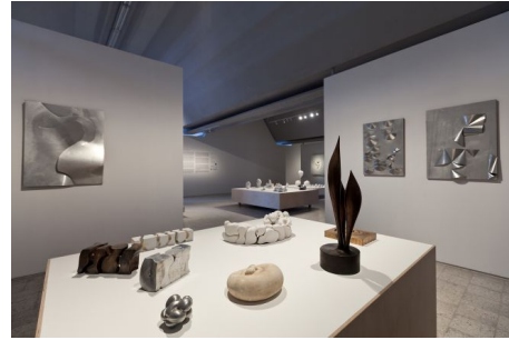
Maria Bartuszonej. Formy przejściowe, Muzeum Sztuki Nowoczesnej w Warszawie.