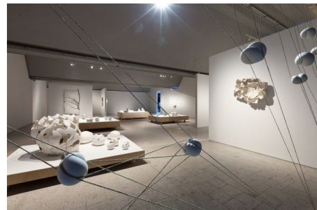
Maria Bartuszová. Formy przejściowe , Muzeum Sztuki Nowoczesnej w Warszawie.

Wystawa ukazuje istotne układy znaczeń i rozbieżności w twórczości Bartuszonej. Rzeźby zostały zaprezentowane bez oznaczeń – nie poznajemy ani czasu powstania ( chronos ), ani tytułów poszczególnych prac ( logos ). Zaprezentowane na wystawie prace w większości pozbawione są tytułów: problem w nazewnictwie wynika zapewne z pewnej ich niesprowadzalności do tego, co daje się jasno uchwycić i czytelnie zdefiniować. Z pomocą przychodzi tu nazwa wystawy, określająca rzeźby mianem „form przejściowych”. Termin ten trafnie ujmuje specyfikę prac artystki: nie (do)określa ich, lecz