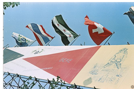
Dekoracyjny fryz autorstwa Wojciecha Fangora i Henryka Tomaszewskiego wzdłuż ulicy Marszałkowskiej w Warszawie z okazji V Światowego Festiwalu Młodzieży i Studentów, 1955.

OB: Niebagatelny. Zdałam sobie z tego sprawę w trakcie wywiadów, rozmów, czytając to, co pisali odbiorcy po premierze książki. Dostałam wiele wiadomości, które zdradzały wrażliwą i uważną lekturę, ale czasami odnosiłam wrażenie, że bez względu na to, jak wiele złożonych kwestii starałam się poruszyć, pokazując, że trudno o łatwe wnioski, to dla niektórych rzecz sprowadza się do rozmowy o tym, czy w Polsce jest rasizm, czy go nie ma. Dyskurs w Polsce jest specyficzny, co wynika częściowo z tego, że nie mieliśmy kolonii. Chcieliśmy je mieć, ale to się nie udało, więc nie mamy typowych relacji postkolonialnych, a te które mamy są bardziej niejednorodne. Mamy historię PRL-u, w której ogromną rolę odgrywała współpraca, często na poziomie jednostkowym, biograficznym. Pozostały po niej doświadczenia ludzi, Polaków i i osób z kontynentu Afrykańskiego, którzy razem pracowali przy projektach w dekolonizujących się krajach Europy i tych, którzy studiowali w Polsce. Wydaje mi się, że nie korzystamy z tych doświadczeń, a właśnie dzięki nim moglibyśmy budować bardziej progresywne polityki dotyczące migracji czy współpracy z państwami, z którymi mieliśmy kiedyś dobre relacje polityczne i gospodarcze. Zamiast tego zasilamy w naszych