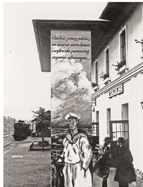
Mural propagandowy Ligi Morskiej i Kolonialnej w Marcinkowicach niedaleko Nowego Sącza około 1936 roku.

TLNV: Zgadzam się, ale widzę też potencjalne ograniczenia i niebezpieczeństwa podtrzymywania tej osobności polskiej sytuacji. Wiemy, że myślenie, iż w Polsce było inaczej niż na Zachodzie może kultywować mit o wyjątkowości Polski jako miejsca i panującej w nim kultury. Takie trzymanie się wizji unikalności historii Polski często wzmacnia myślenie, że polskiej historii nie da się porównać do historii żadnego innego kraju i tym samym może też zamykać możliwość widzenia nowych połączeń, twórczych analogii. Takie myślenie choć może