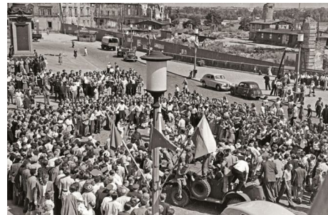
V Światowy Festiwal Młodzieży i Studentów w Warszawie, 1955. Festiwalowicze tańczą pod kolumną Zygmunta, w tle ruiny Zamku Królewskiego.

Z jednej strony poznajemy go jako osobę dynamiczną, odnajdującą się w wielu krajach i kontekstach, z drugiej, czuć w jego historii rodzaj pęknięcia. Opowiada on przecież o pewnej atomizacji wśród osób, które jak on były dziećmi wojny i tak jak on wychowywały się w domach dziecka. Wydaje mi się, że Twoja książka może stać się ważnym punktem odniesienia dla innych mniejszości, wydobywając rozmaite