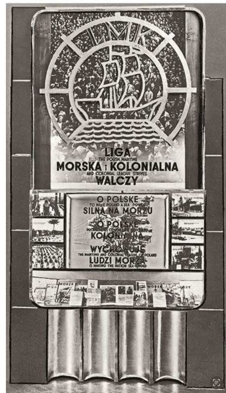
Wystawa Światowa w Nowym Jorku – stoisko propagandowe Ligi Morskiej i Kolonialnej w polskim pawilonie, zaprojektowane przez Macieja Nehringa, 1939. Zbiory Narodowego Archiwum Cyfrowego

Od początku lat 60. do Polski Ludowej coraz liczniej zaczynają przybywać studenci z dekolonizujących się krajów afrykańskich,