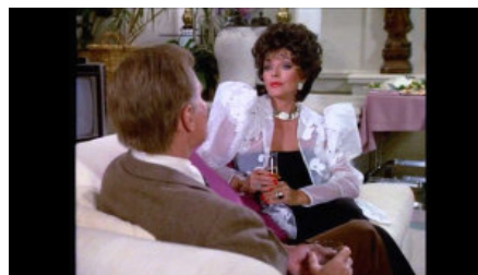
Dynastia , 1981–1989, w Polsce emisja od 2 lipca 1990

Bo wydawało się, że jest. Konserwatyści u władzy obniżyli podatki, spadły też ceny ropy i złota, co zachęcało zamożniejszych do wydawania na stroje coraz większych kwot. Wielkie domy mody, jak Chanel, przeżywały renesans i zabiegały o masowego odbiorcę, sprzedając na niespotykaną wcześniej skalę torebki, perfumy i inne akcesoria. W ślad za umacniającym się rynkiem towarów