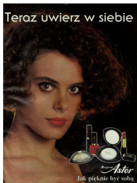
Reklama Margaret Astor, 1993

„Obciach” epoki transformacji w modzie męskiej, szczególnie w dzisiejszej pamięci o epoce, to słynne białe skarpetki (sprzedawane na łózkach polowych, noszone do mokasynów i nawet do sandałów), które niczym ludowy odpowiednik białego