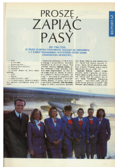
Proszę zapiąć pasy, reportaż Jacka Szmida, „Twój Styl”, marzec 1991: „Portrety stewardes wykonał po powrocie samolotu z Paryża – Maciej Osiecki. Bohaterki reportażu pozowały do zdjęć po bardzo męczącym locie. Samolot miał dwie godziny spóźnienia”

To jednak moda okresu transformacji posłużyła rodzącej się klasie średniej do tego, by skonstruować się od podstaw. Na Zachodzie lata 80. to poza wszystkim dekada power dress : poszerzone ramiona, elementy męskiej garderoby, androgyniczność luźnej linii. Słynny dyptyk zdjęciowy Sie kommen (Nadchodzą) Helmuta Newtona powstał co prawda w 1981 roku, ale mógłby ilustrować sytuację w Polsce dziesięć lat później, gdy na nowe stanowiska w firmach ruszyła armia asystentek i sekretarek. W modzie zachodniej początków lat 90. nastał już co prawda minimalizm gładkich strojów od Armaniego czy Jil Sander, odpowiedź na światową recesję, ale Polki naśladowały wtedy inne wzory. Nie szukały wyrafinowanej prostoty: albo walczyły o przetrwanie w sytuacji zamykania zakładów pracy, albo robiły szybkie kariery i potrzebowały efektownego umundurowania. Wkładały białe bluzki, dopasowane spódnice, żakiety kolorowe lub właśnie szare, co miało podkreślać profesjonalizm. W reportażowym cyklu